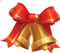
9 «Б» класс