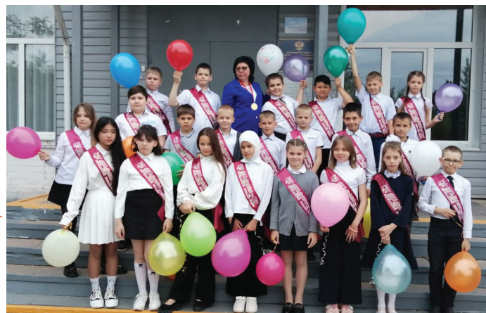
4 «Б» класс