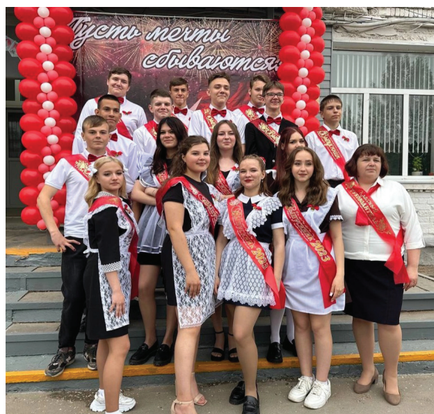
9 «А» класс

Дорогие выпускники! Пусть принятые Вами решения окажутся верными, а шаги — правильными. Тот новый путь, в который вы совсем скоро отправитесь, будет не всегда простым, но пусть он обязательно будет ярким и исполняющим мечты!